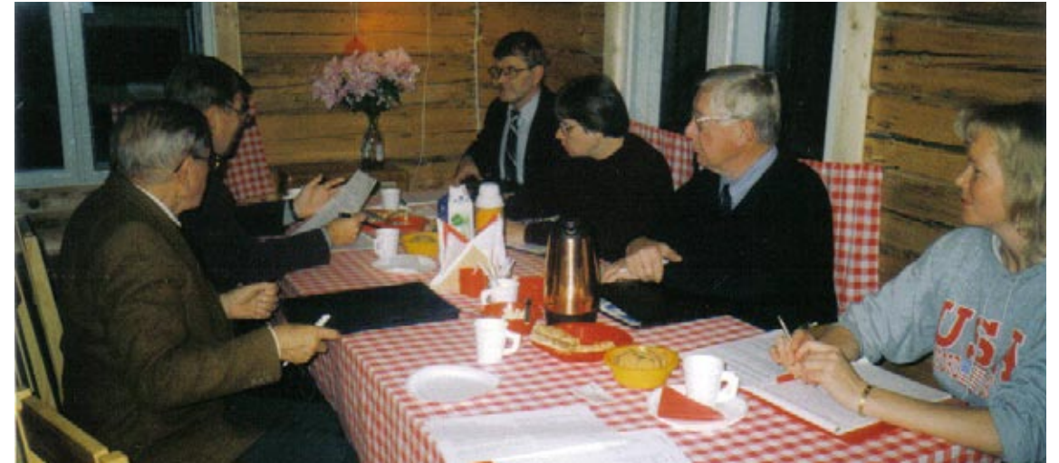
Sukuseuran hallituksen järjestäytymiskokous Nastolassa 1997.