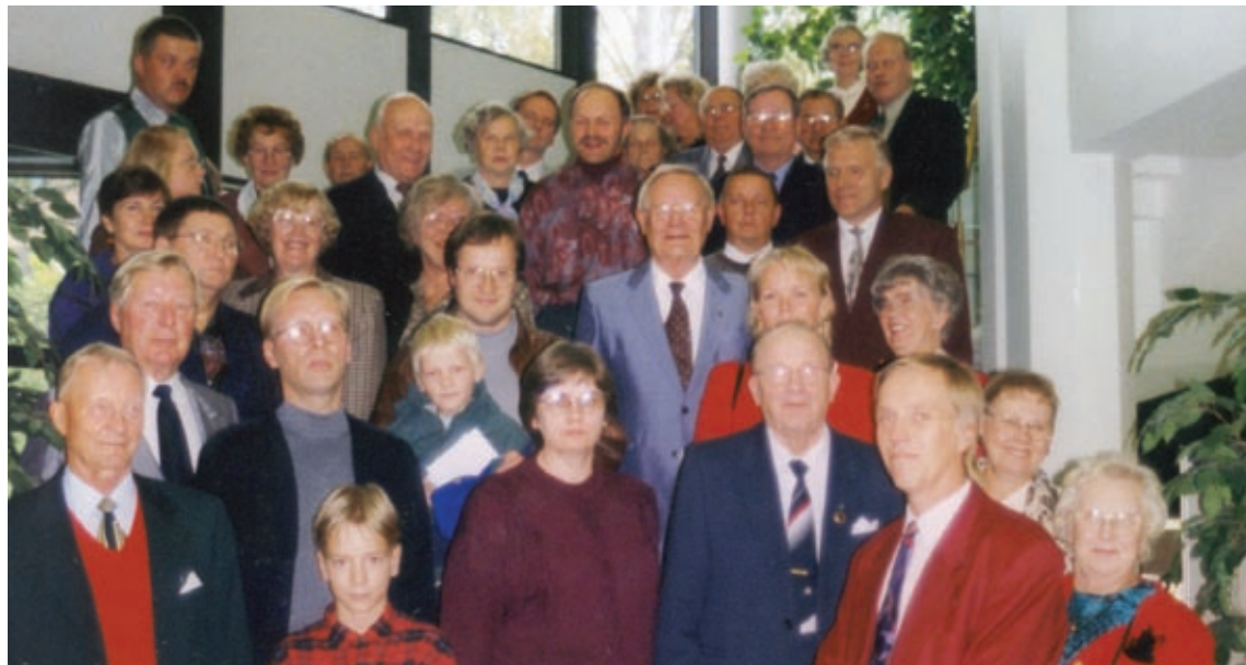
Sukuseuran perustavan kokouksen osallistujia Lahdessa kesällä 1997.