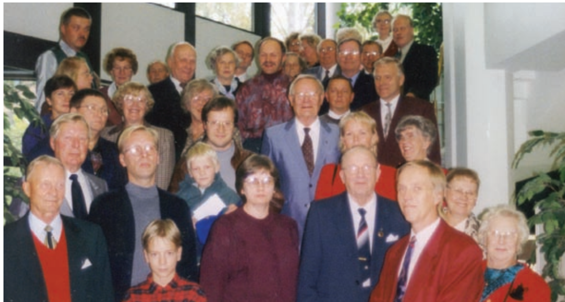
Sukuseuran perustavan kokouksen osallistujia Lahdessa kesällä 1997.